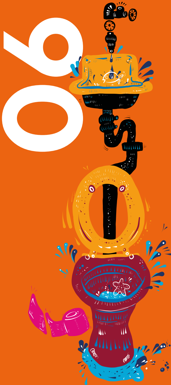
Illustration: Franziska Moltenbrey | Gestaltung: www.das-hinterland.de