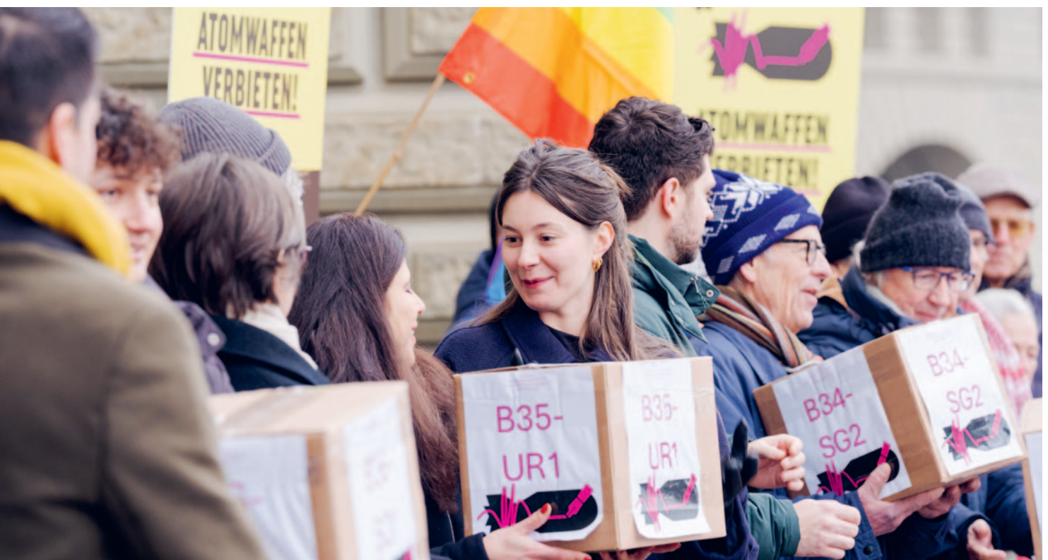
Am 23. Dezember 2025 wurden die Unterschriften in Bern eingereicht